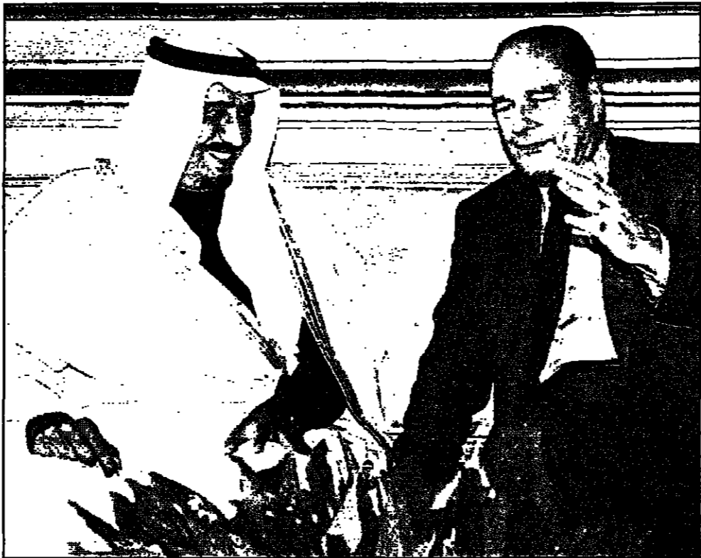
امير منطقة الرياض سلمان بن عبد العزيز أثناء لقائه مع الرئيس الفرنسي جاك شيراك في باريس

■ واشنطن - اف ب د - أعلن مدير مكتب التحقيقات الفدرالي (اف بي اي) أمس ان التحقيق في انفجار الخبر الذي أودى بحياة 19 جنديا امريكيا في شهر حزيران (يونيو) الماضي قد حقت تقدمه، وان النهاية أصبحت «قرينة جدا». وأعلن مدير مكتب التحقيقات الفدرالي (اف بي اي) أمس ان التحقيق في انفجار الخبر الذي أودى بحياة 19 جنديا امريكيا في شهر حزيران (يونيو) الماضي قد حقت تقدمه، وان النهاية أصبحت «قرينة جدا». وأعلن مدير مكتب التحقيقات الفدرالي (اف بي اي) أمس ان التحقيق في انفجار الخبر الذي أودى بحياة 19 جنديا امريكيا في شهر حزيران (يونيو) الماضي قد حقت تقدمه، وان النهاية أصبحت «قرينة جدا».